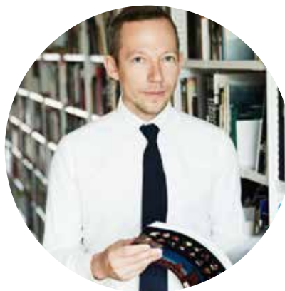
Антон Белов, директор Музея современного искусства «Гараж»