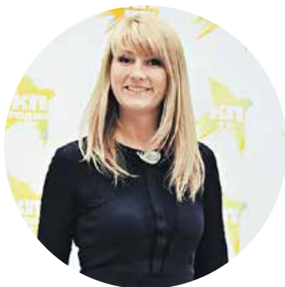
Светлана Журова, конькобежка, заслуженный мастер спорта России