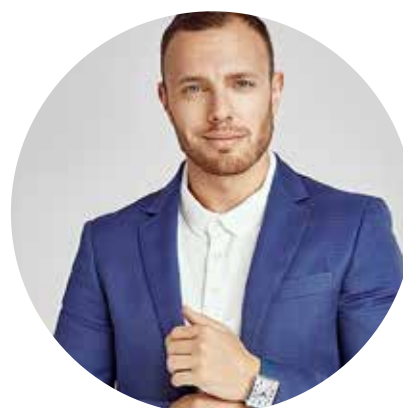
Тимур Соловьев, телеведущий, актер