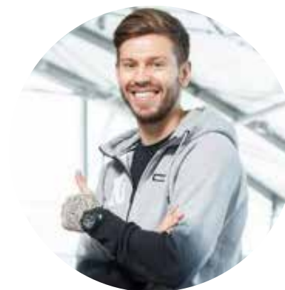
Федор Смолов, футболист