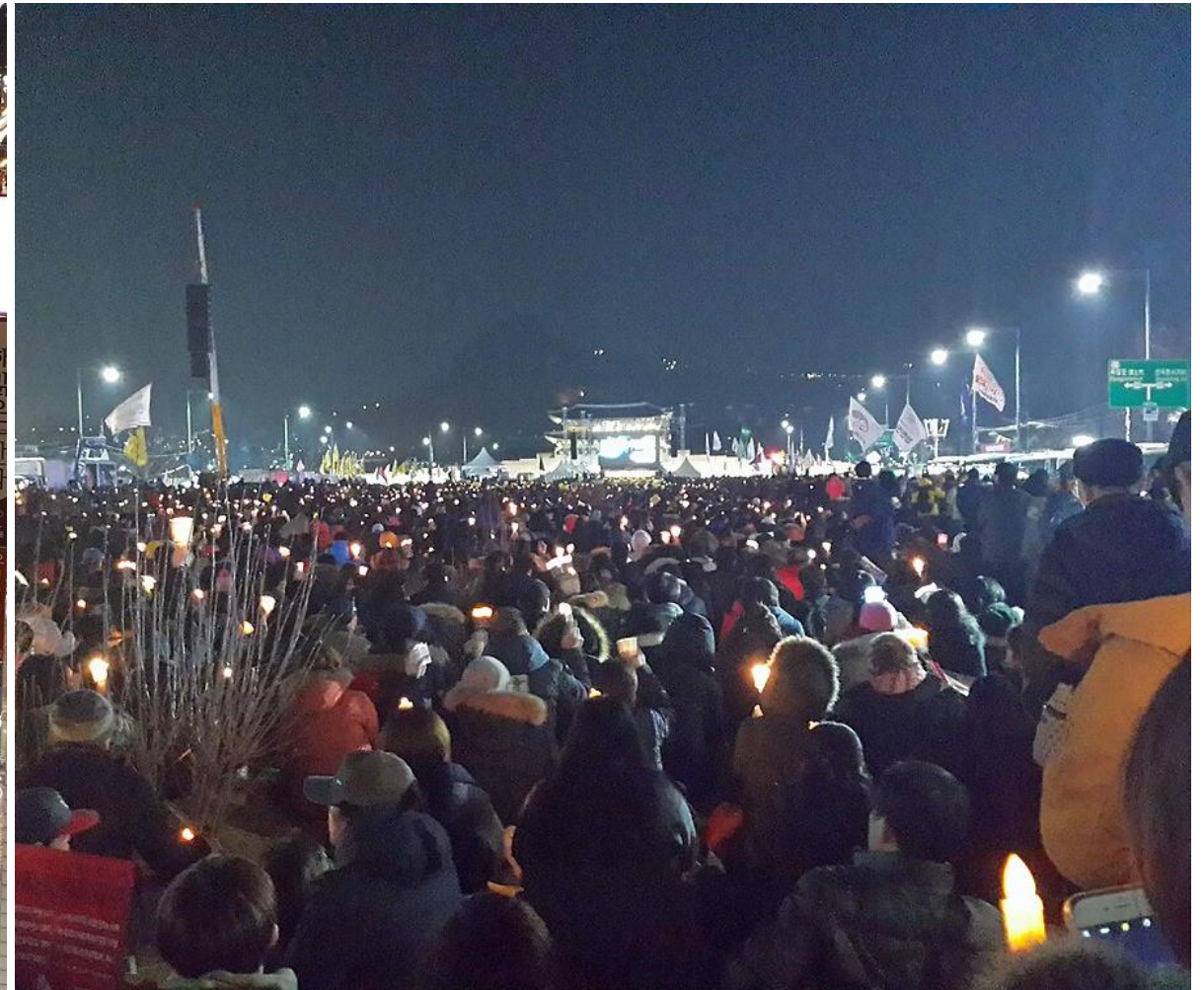
«Революция свечей», 2016 год