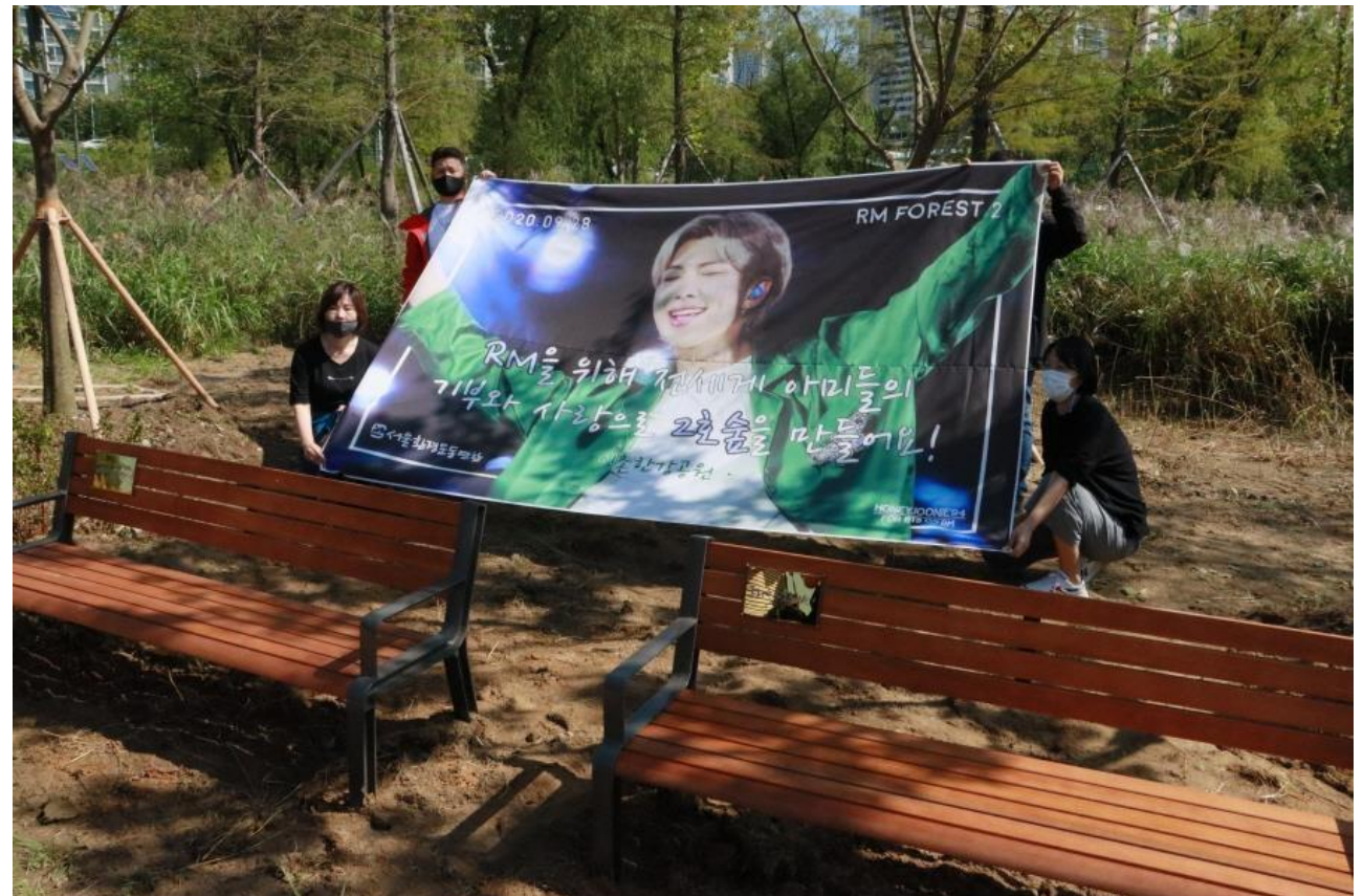
Лес в Сеуле, в 2020 году высаженный сообществом фанатов RM – лидера К-поп группы BTS