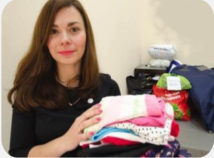
Праздник свободного гардероба для офисов и организаций