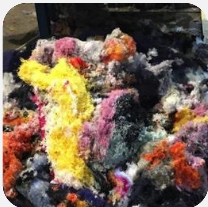
Разволокнение техническая вата, набивка, утеплители