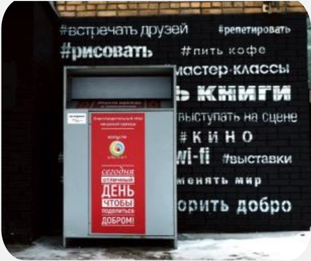
Стационарный контейнер для сбора ненужной одежды