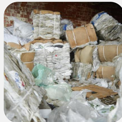
Отправка пластиковых пакетов в переработку