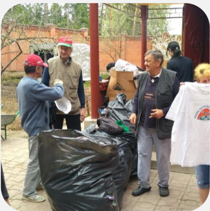
Люди, в трудной жизненной ситуации