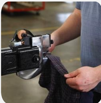
Роспуск в обтирочную ветошь для предприятий