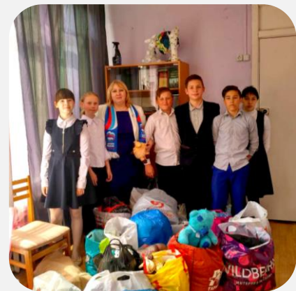
Многодетные семьи, одинокие пенсионеры