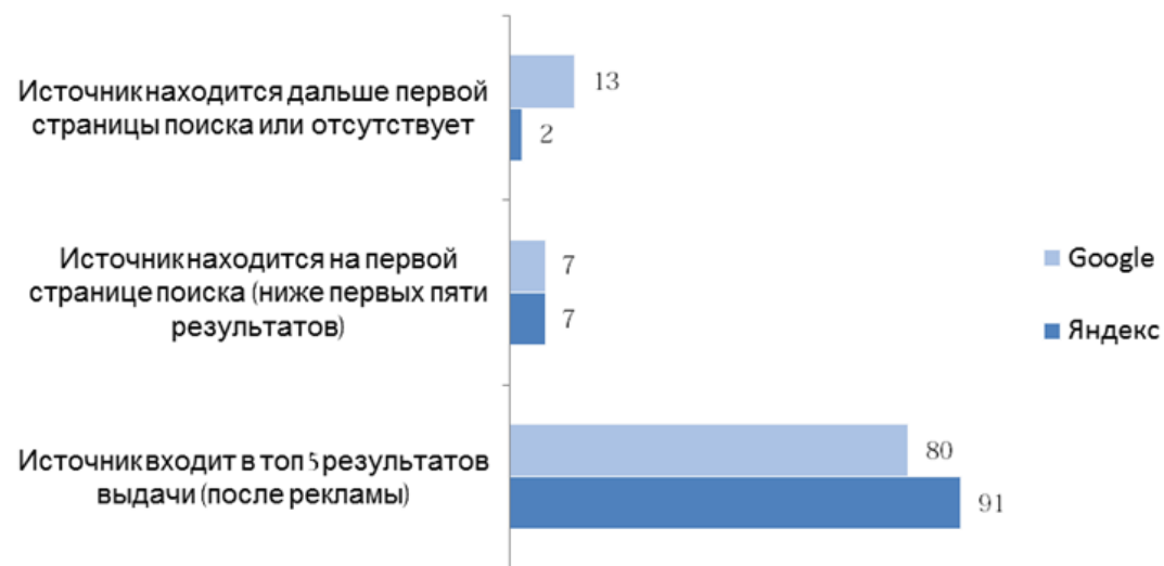
Результаты оценки регионов по блоку 2, %

Блок 3 – оценка доступности информации в социальных сетях Facebook и Вконтакте. Оценивалось наличие групп, посвящённых поддержке НКО в регионе, либо новостей и упоминаний (до 6 баллов)