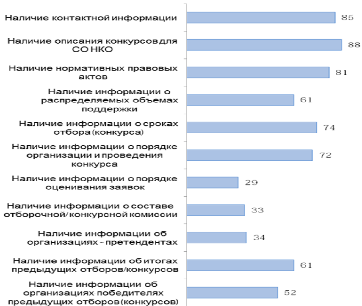
Результаты оценки регионов по блоку 1, %