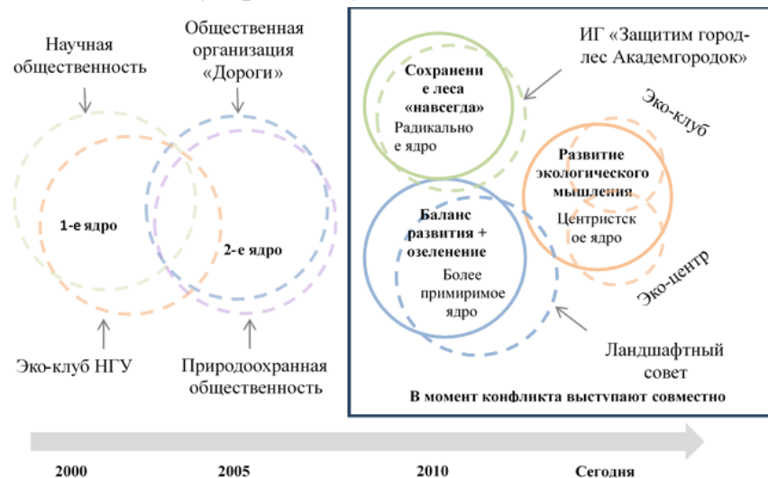
ОС на основе сетевых репрезентаций сообществ-интересов. Конфликт «Тангейзер» Подготовила С. Шамрина, 2016