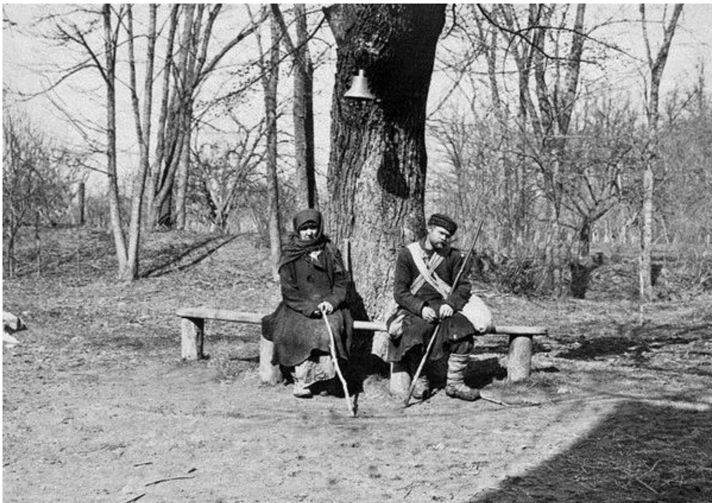
Крестьяне в Ясной Поляне, ожидающие выхода Л.Н. Толстого у дерева «бедных», 1908