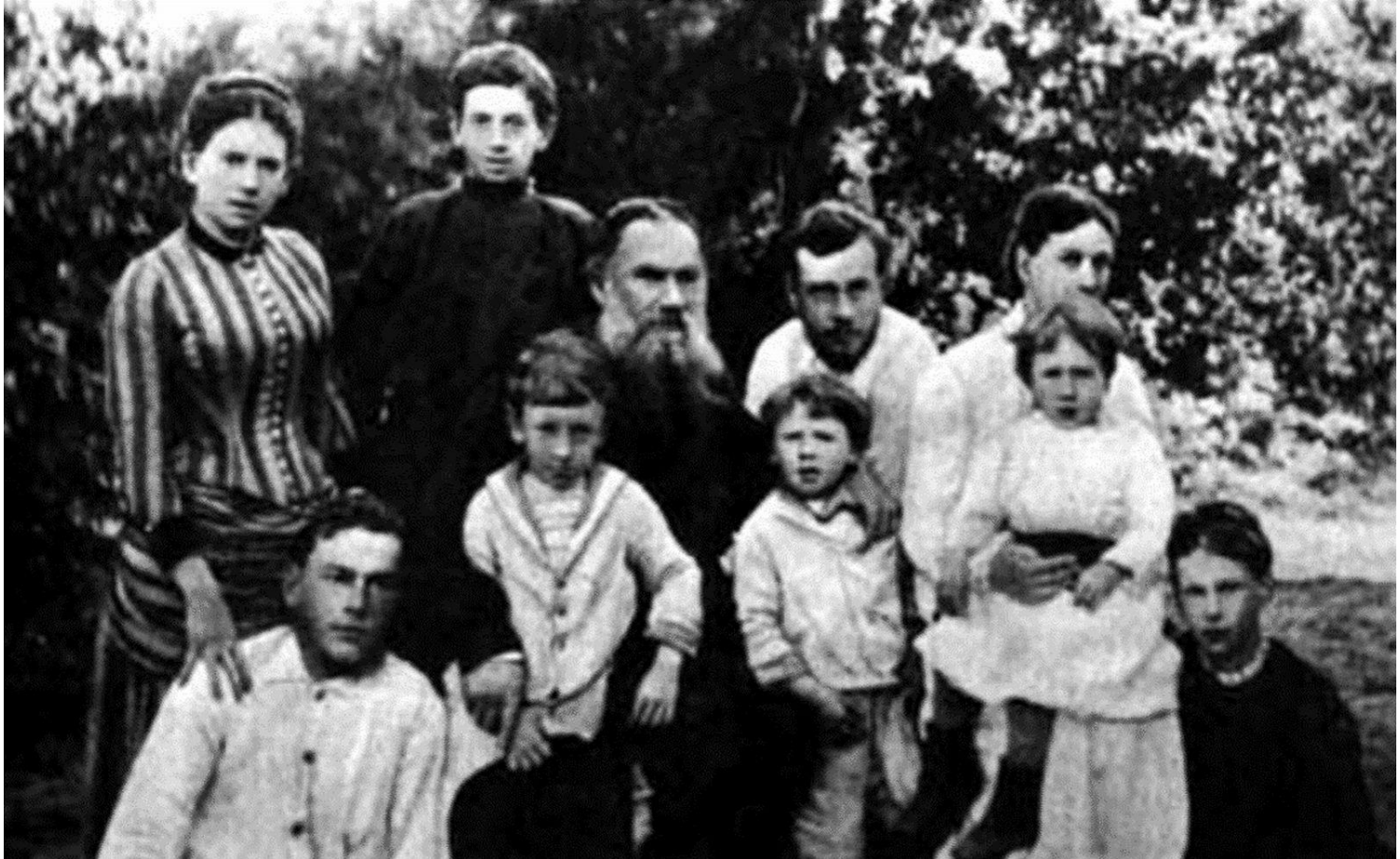
Л. Толстой (56), С. Толстая (40), 6 сыновей (21-3), 3 дочери (20-1)