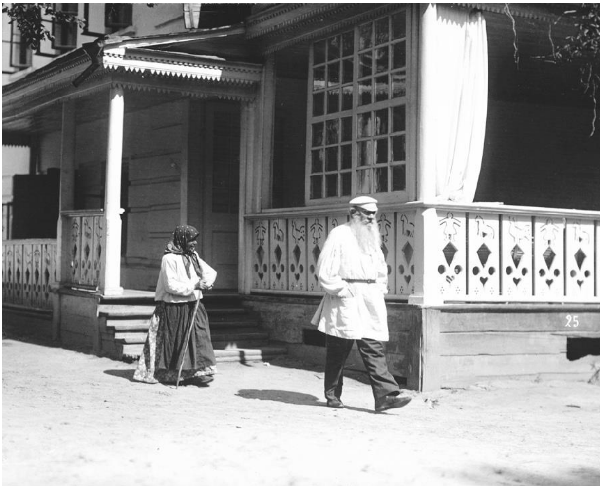
«Л. Толстой преследуемый просительницей». К. Булла.1908. Государственный музей Л.Н. Толстого