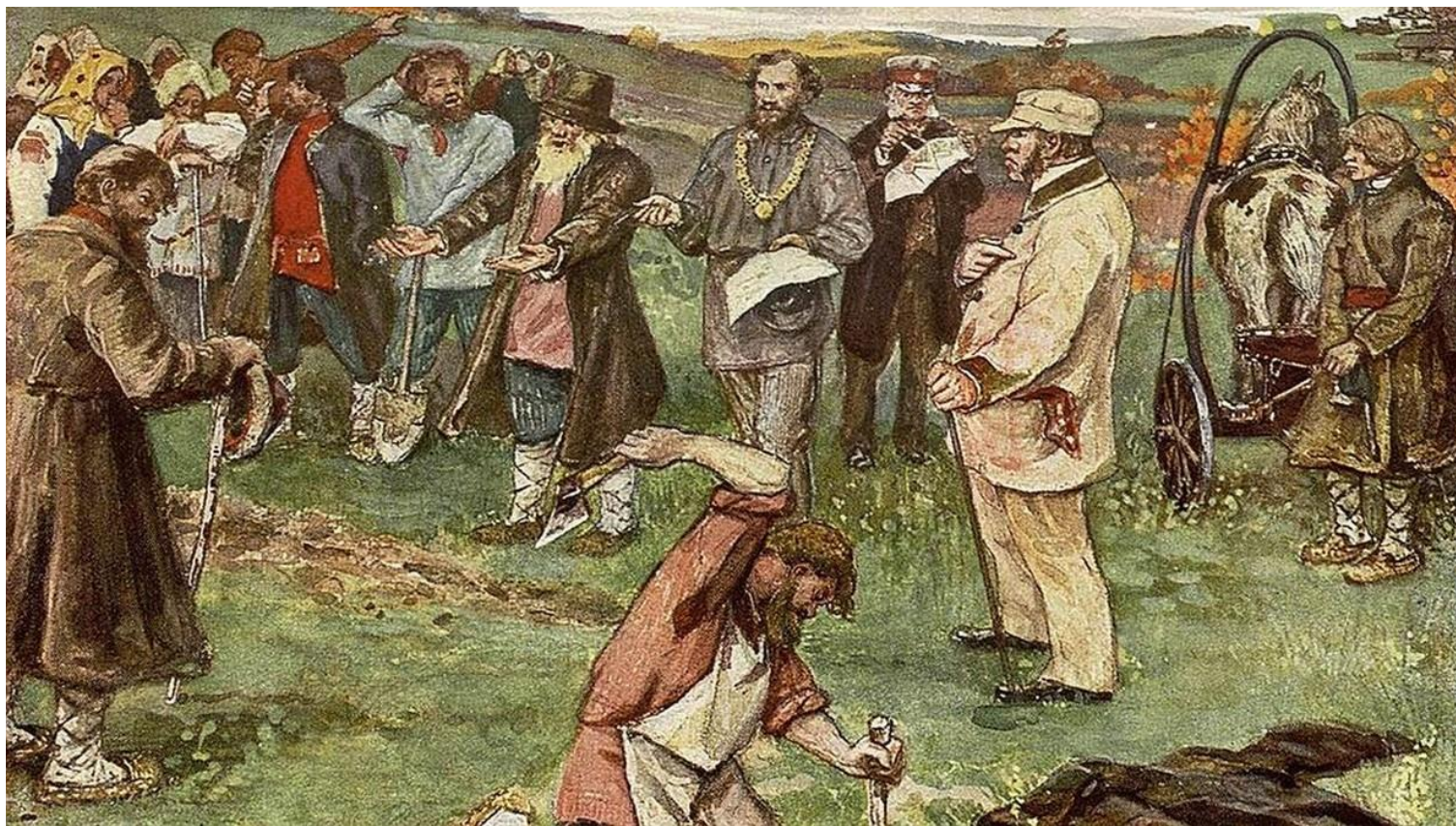
В.Н. Курдюмов Л. Н. Толстой - мировой посредник, нач. XXв. Государственный музей Л.Н. Толстого