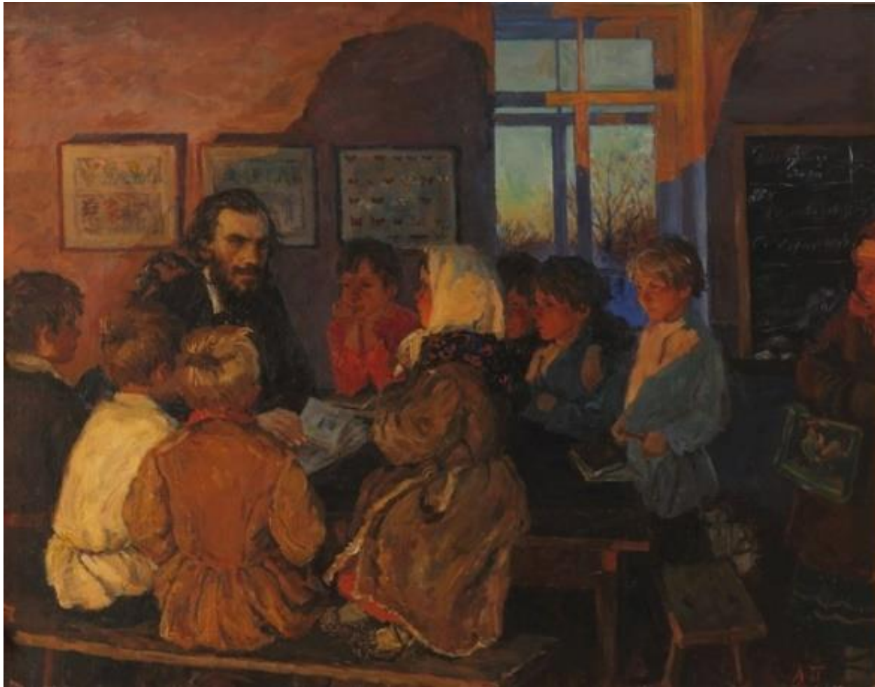
А. А. Пластов Толстой с яснополянскими школьниками, 1959. Государственный музей Л.Н. Толстого