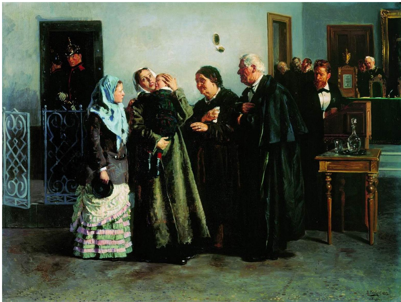
В. Е. Маковский Оправданная, 1882 Государственная Третьяковская галерея.