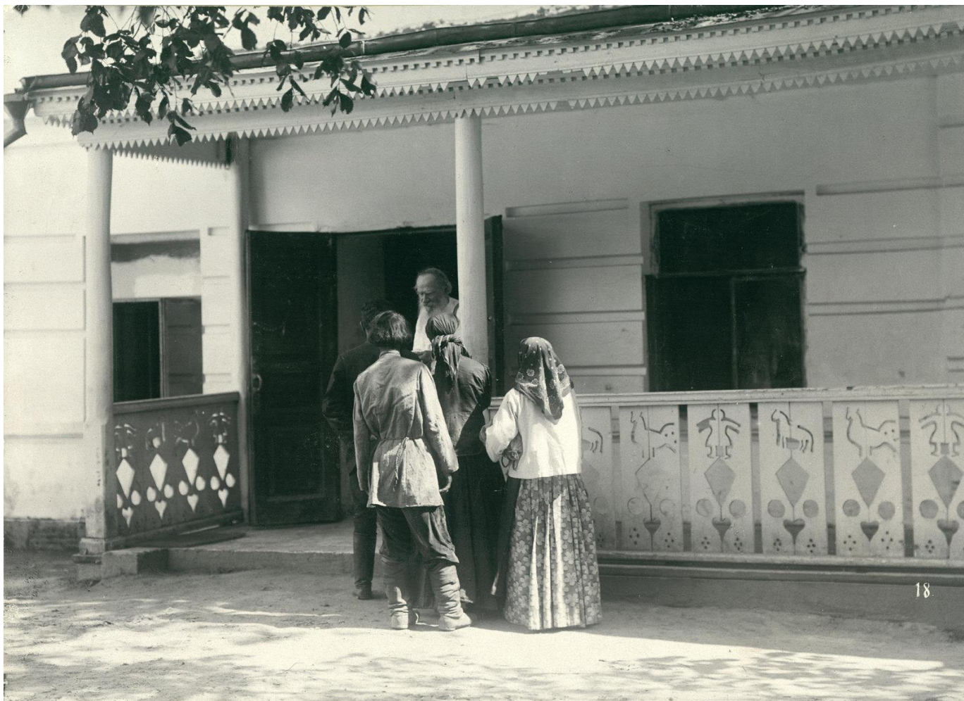
«За советом» у Толстого». 1908.