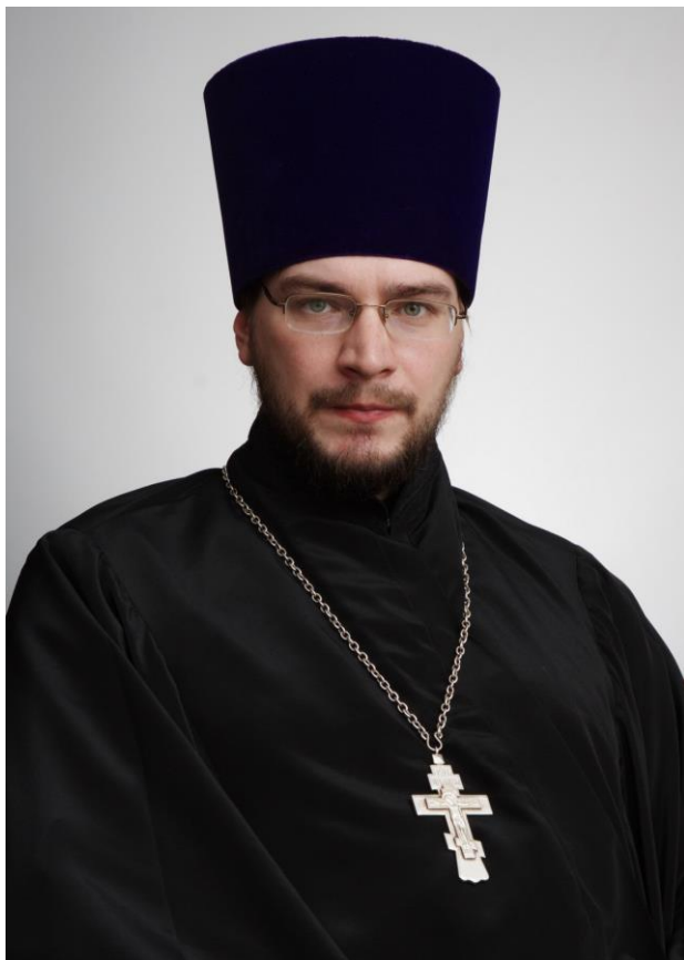
Протоиерей Олег Мумриков, член Синодальной комиссии по биоэтике