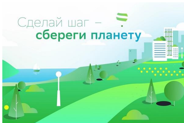
«Сбереги планету» (совместный проект «Сбера», дизайнера Б. Тодаевой и художника Д. Ребуса, 2021)

Взаимодействие бизнеса, музеев, образовательных организаций и представителей экоискусства позволяет эффективно решать задачи социальных инвестиций и человеческого капитала.