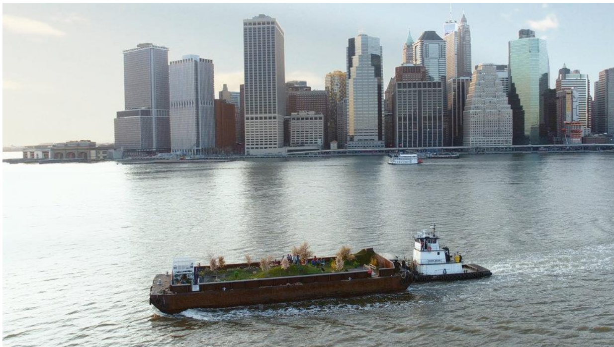
М. Мэттингли. Swale. 2016

Устойчивое искусство – это направление современного искусства, близкое к экологическому искусству, создаваемое с учётом его воздействия на природу, общество, экономику и культуру. Устойчивое и экологическое искусство способно развивать индивидуальную агентность и формулировать эмоциональные и интуитивные реакции.