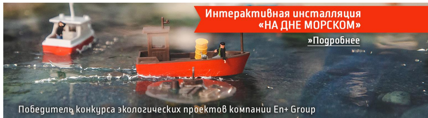
Победитель конкурса экологических проектов компании En+ Group

(выставка Московского музея дизайна при поддержке СИБУРа, 2021)