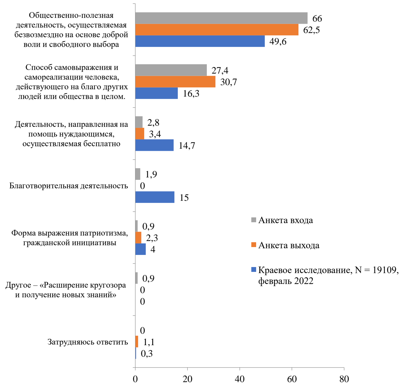
Диаграмма 2. Добровольчество в понимании респондентов, один вариант ответа, %