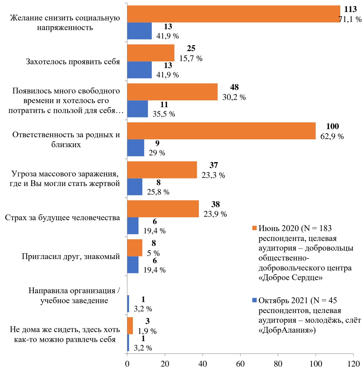
Диаграмма 4. Мотивы участия респондентов в деятельности по оказанию помощи нуждающимся в период пандемии