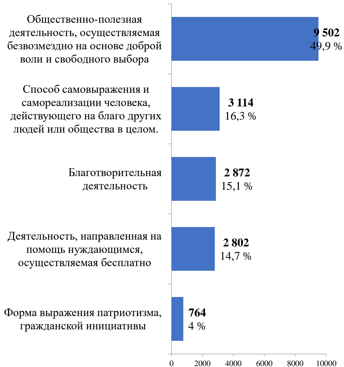
Диаграмма 1. Добровольчество в представлении респондентов (при ответе на данный вопрос респонденты могли выбрать один вариант ответа), 19 109 респондентов, опрос проведен на территории Ставропольского края