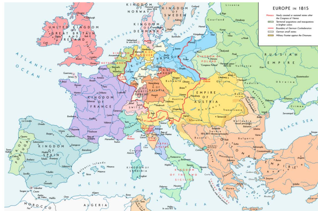
Концерт европейских держав после наполеоновских войн