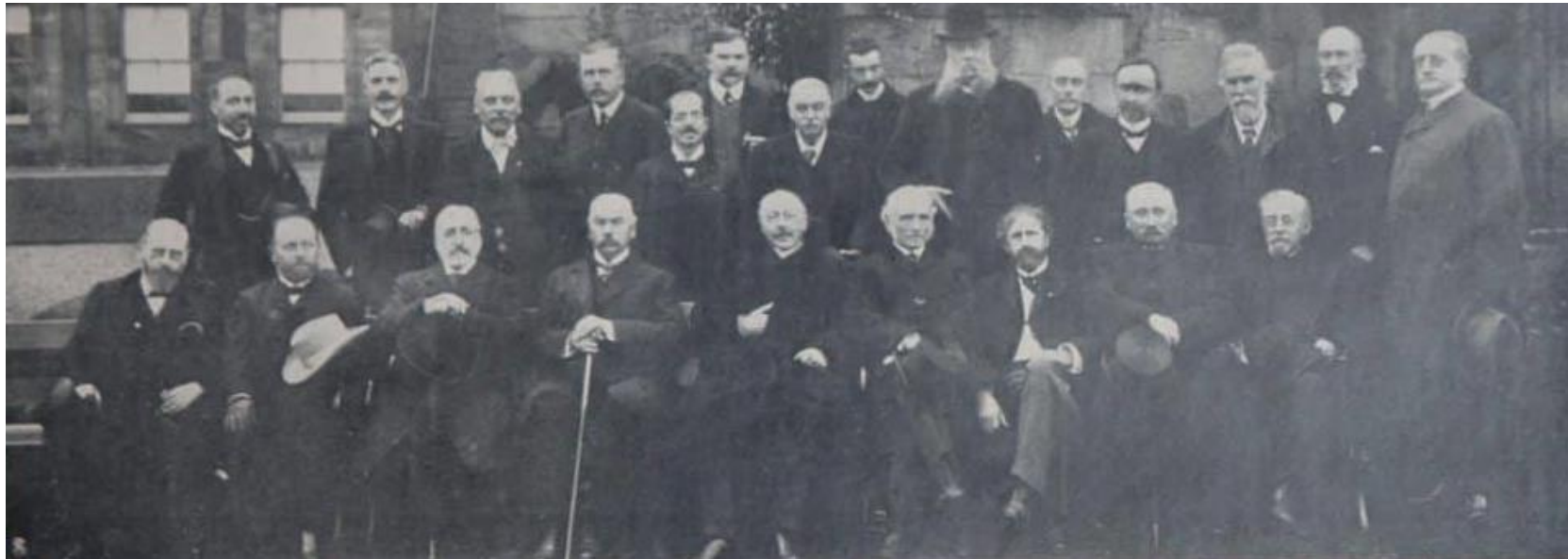
Съезд Института международного права в Эдинбурге, 1904 г. На фотографии можно увидеть Ф.Ф. Мартенса – 1й ряд, 4й слева